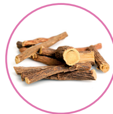
КОРЕНЬ СОЛОДКИ ГОЛОЙ

Основной компонент Асигарда — Солодка голая — обладает спазмолитическим, антибактериальным, противовоспалительным действием, умеренно понижает кислотность желудочного сока, помогает предотвратить язвенную болезнь и приступы гастрита и изжоги. Солодка также стимулирует выброс химических веществ, вовлечённых в заживление повреждённых кислотным рефлюксом тканей пищевода и желудка. Глицирризиновая кислота, активное вещество Солодки, препятствует прикреплению бактерии Helicobacter Pylori (основной